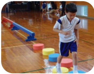
< 運動会 >