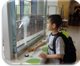
< 校外学習 >