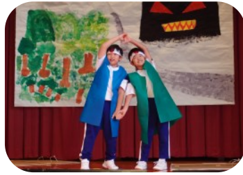
< 学習発表会 >