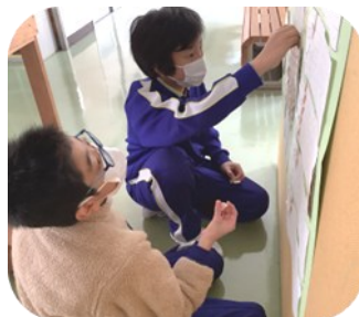
< 委員会活動 >