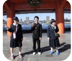
< 修学旅行 >