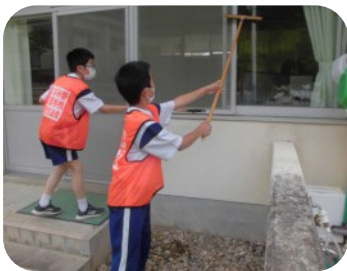
< 全校ボランティア活動 >