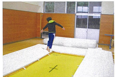
～埋め込み式トランポリン～